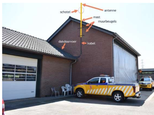
Foto van de opstelling van PI3ZLB

Sinds een aantal jaar staat de repeater PI3ZLB opgesteld in Hulsberg. Na een paar jaar van afwezigheid werd een stichting opgericht om onder anderen het beheer van deze repeater in goede banen te leiden en toekomstbestendig te maken. De Stichting Radioamateurstations Zuid-Limburg verzorgt het beheer en de ontwikkeling en bestaat uit een 3-koppig bestuur met afvaardiging van beide verenigingen en een werkgroep die de praktische zaken uitvoert.